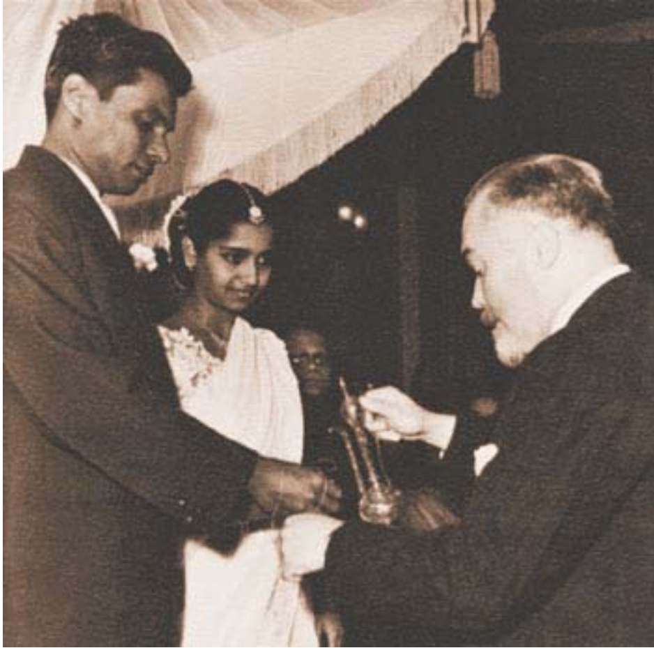
Ю.Н. Рерих совершает буддийскую церемонию на свадьбе дочери цейлонского посла. Москва, 1959