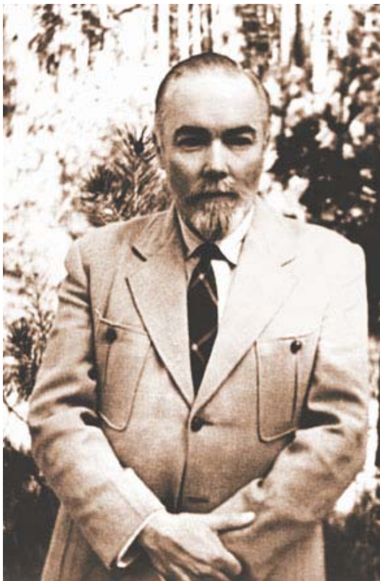
Юрий Николаевич Рерих. Москва, 1958 год