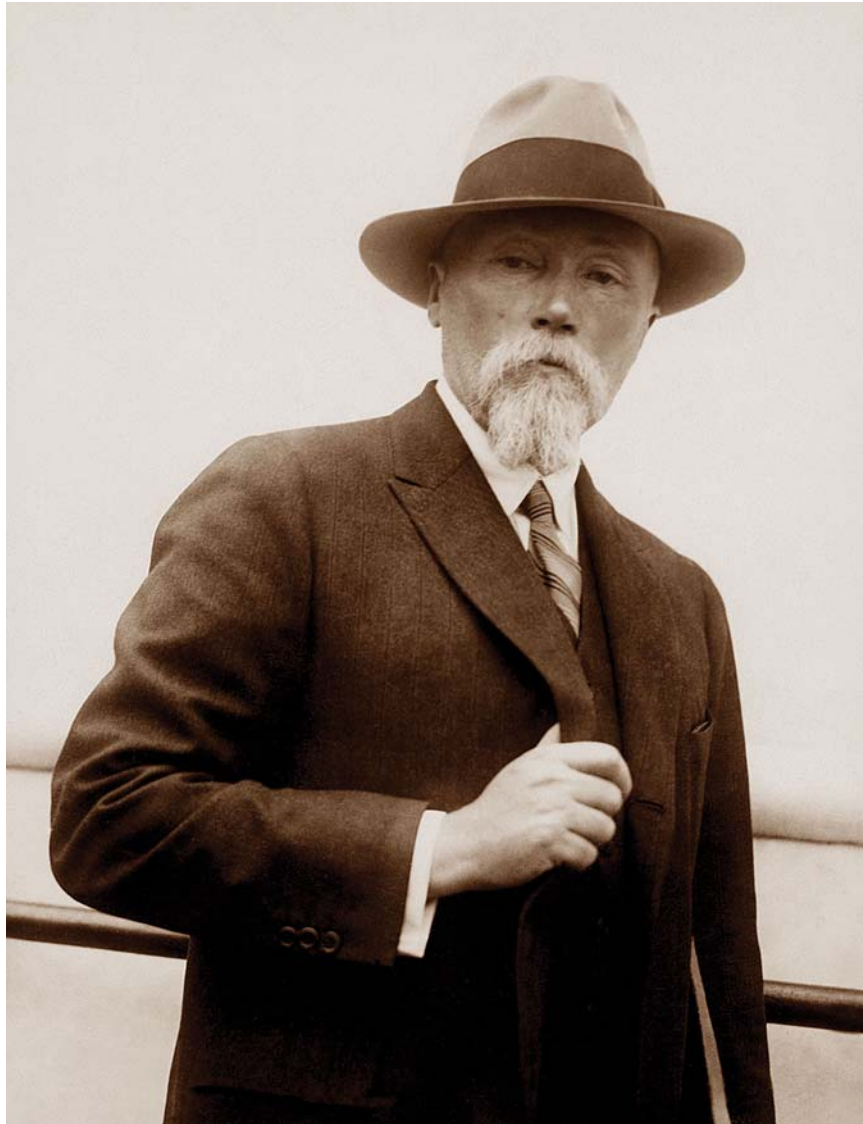
Н.К. Рерих в Америке. 1929. Архив музея Н.Рериха в Нью-Йорке