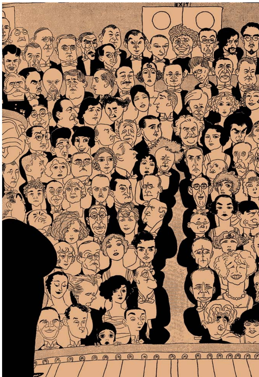
Н.К. Рерих в пантеоне деятелей культуры Америки. Фрагмент дружеского шаржа из газеты. 1922