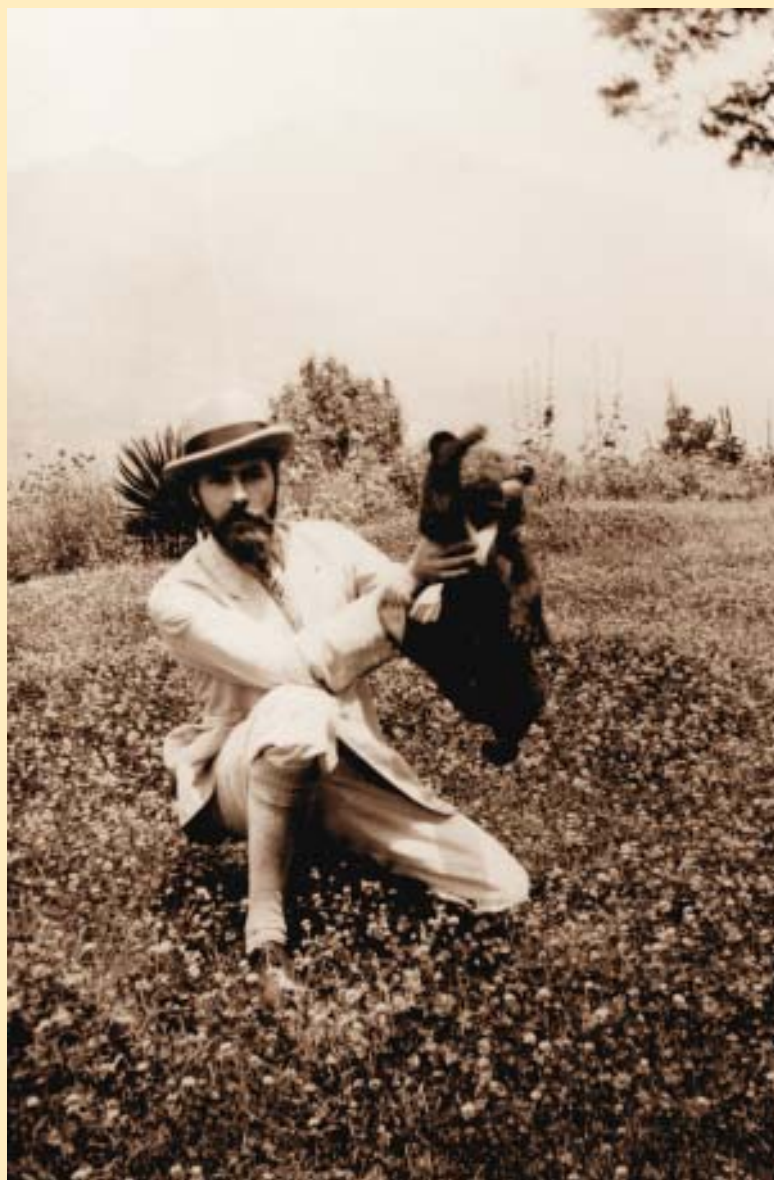
Святослав Рерих с медвежонком. Наггар, 1934