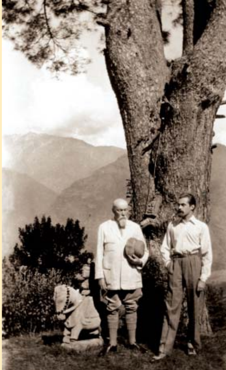
Святослав Рерих с отцом. Наггар. 1931, сентябрь