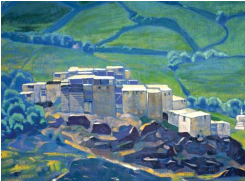
С.Н.Рерих. Лахул. Карданг. 1932. ГМВ

Слышал, что грибочки пришли в Кулу, спасибо большое, отец их очень любит. Об остальных посылках пока не слышал, чтобы они пришли, но, думаю, они скоро придут, если уже не пришли.