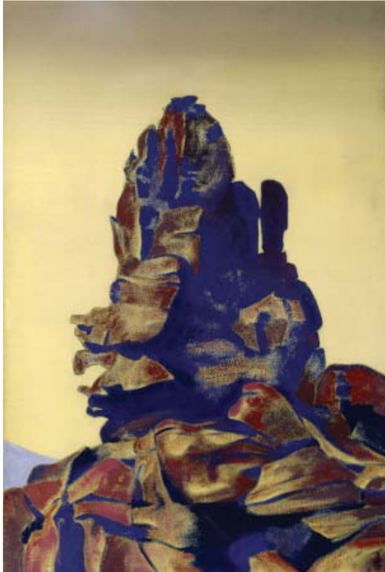
Святослав Рерих. Корсика. 1927. Музей Н. Рериха, Нью-Йорк