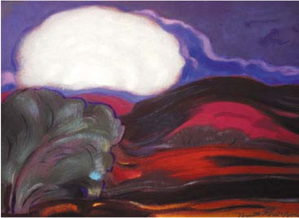
С.Н. Рерих. Пейзаж

с директором Школы Адити Васиштхой, и С.Н. говорил, что это явление необычайно интересное.