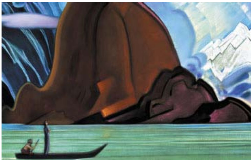
С.Н. Рерих. И мы приближаемся. 1967 (Фрагмент)