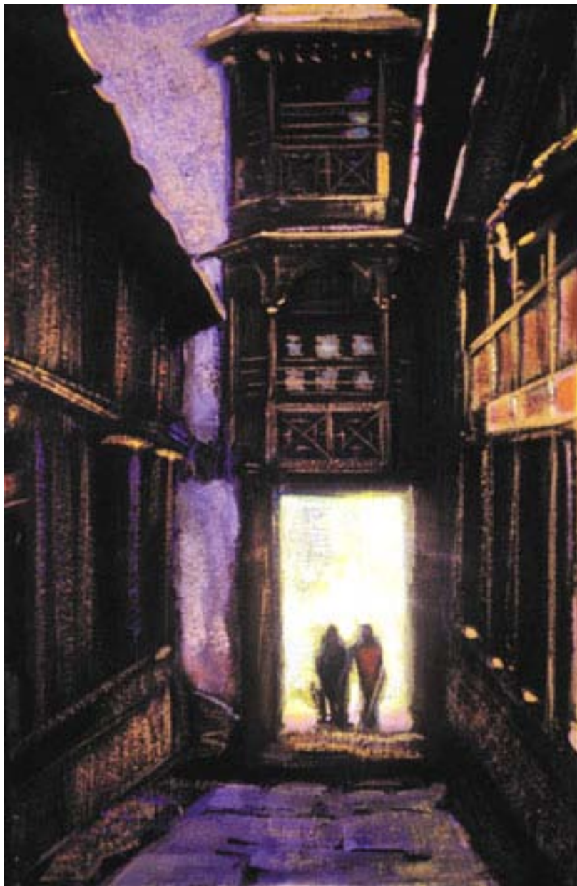
С.Н. Рерих. Тибет