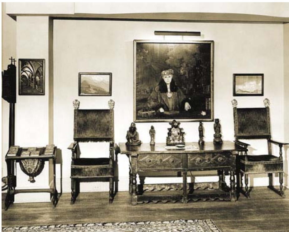
В Музее Николая Рериха. 1950-е годы

Музея в Москве и тому подобное — вызваны тем, что там никогда не соблюдалось это правило. Когда люди приходят сюда, в наш Музей, у них не создается впечатление о каком-то культе.