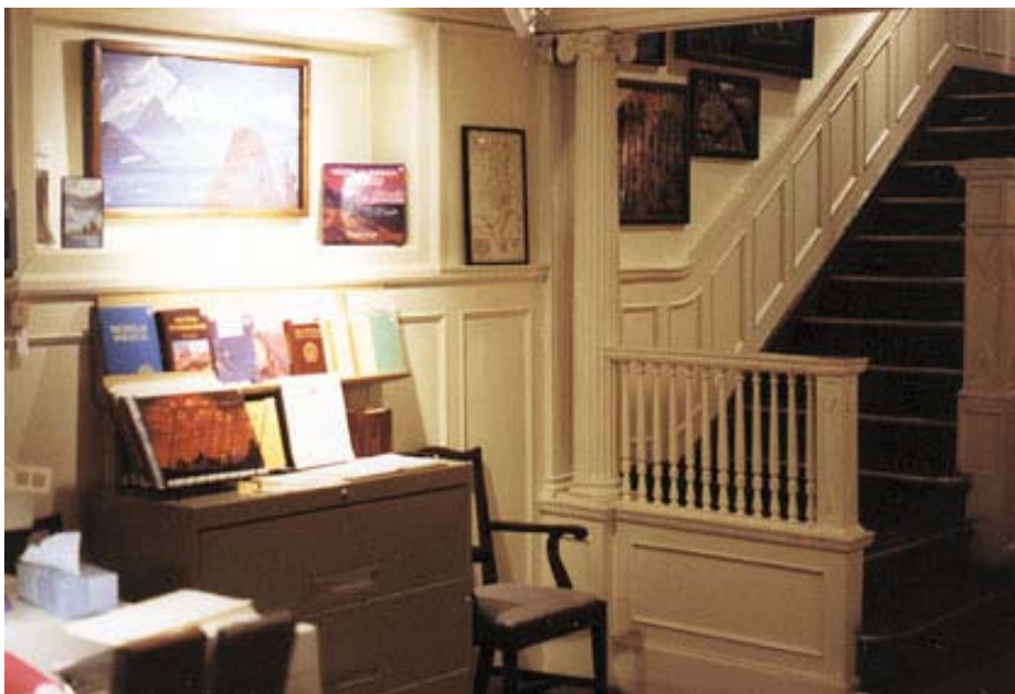
Музей Николая Рериха в Нью-Йорке