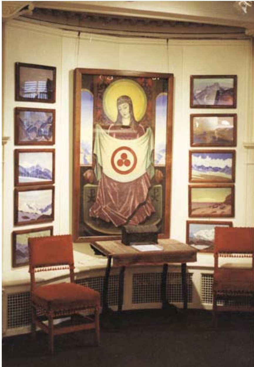
Музей Николая Рериха в Нью-Йорке