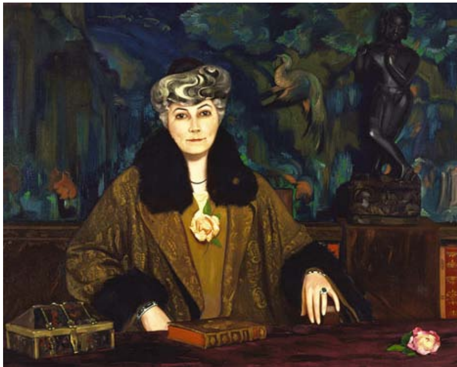
С.Н.Рерих. Портрет Е.И.Рерих. (Фрагмент) Музей Н.Рериха. Нью-Йорк

1.1.1924. Христос сказал Будде: «Негоже Самим Храмы строить, Самим на колокольне звонить. Брат Будда, собери тех людей, которые могут третий глаз возжечь, помоги им пустыню пройти, надели их достатком строительным, чистую звезду перед ними зажги, воздай меру доверия. Пусть Храм вознесется руками человеческими, чтобы было куда войти Нашему Собору. Удумаем, куда посадить строителей, какую мерою честь воздать тому, кто за Нас на весь Мир позвонил. Быть тому в Звенигороде». Записана Заповедь Христова 1-го января в 1924 году перед великою горою.